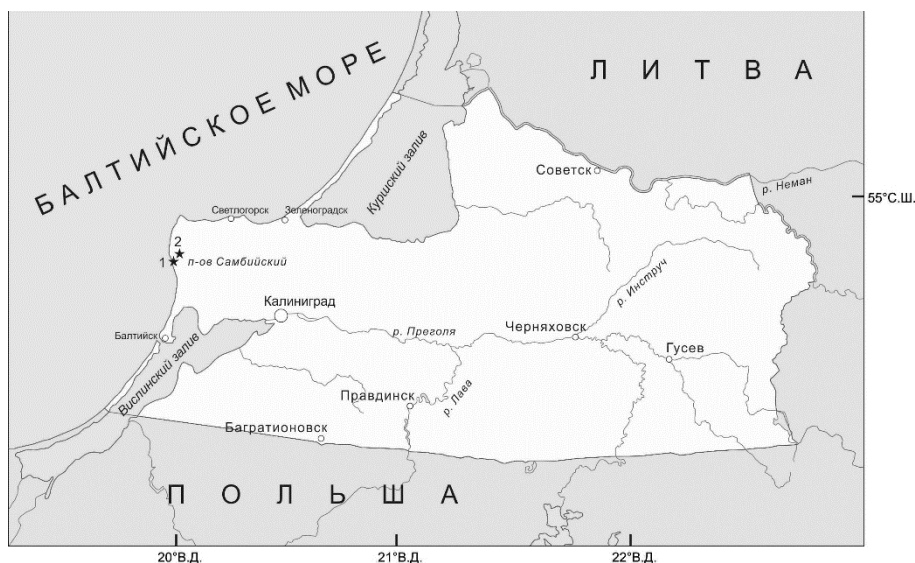
Рис. 1. Карта-схема Калининградской области (звездочками отмечены карьеры месторождений янтаря, в которых вскрыты отложения пальвесской свиты: 1 — Пальменикенское; 2 — Приморское)

Пальвесская свита выделена А.А. Капланом в 1977 г. и названа по старому наименованию пгт Янтарный (до 1946 г. — Пальменикен). Стратотип свиты находится в карьере Приморского местонахождения и имеет два слоя [8].